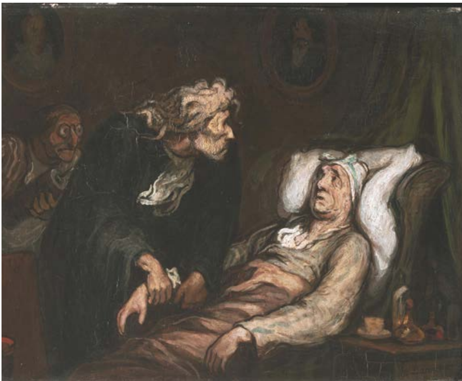
La hipocondría o hipocondriasis es una condición en la cual el paciente presenta una preocupación excesiva con respecto a padecer alguna enfermedad grave.

Puede estar asociado con visitas frecuentes al médico, o puede implicar evitarlas por completo con el argumento de que se podría diagnosticar una afección real y muy posiblemente mortal. Esta última variante me parece bastante racional.