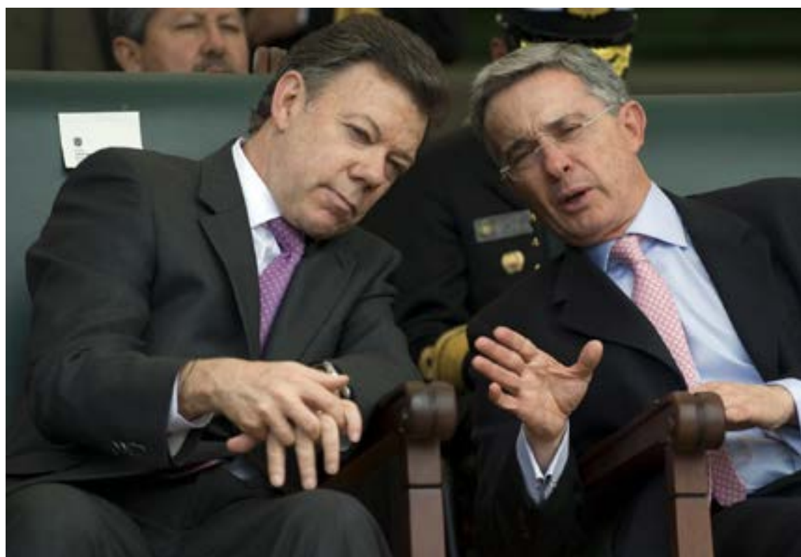
La disputa entre los ex amigos Uribe y Santos reaviva la polarización política en Colombia

Este episodio se suma a una larga lista de confrontaciones que han marcado la política colombiana por más de una década. El Centro Democrático,