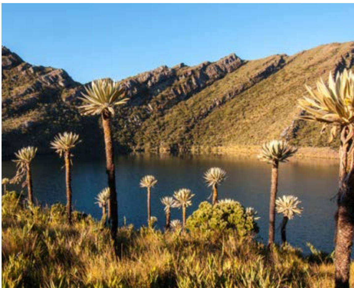
Parque Nacional Chingaza

más larga por las carreteras de Colombia para disfrutar del mar y la playa, cerca a Santa Marta podrá disfrutar de uno de los destinos más apreciados por locales y extranjeros. En el Parque Tayrona no solo se puede acampar con la carpa, existen otras opciones como las hamacas, campings y ecohabs. Si disfrutan pasar la noche a la orilla del mar, el Cabo San Lucas puede ser la mejor opción, pero teniendo en cuenta el aislamiento, Castilletes también es muy recomendable, pues no hay mucha aglomeración.