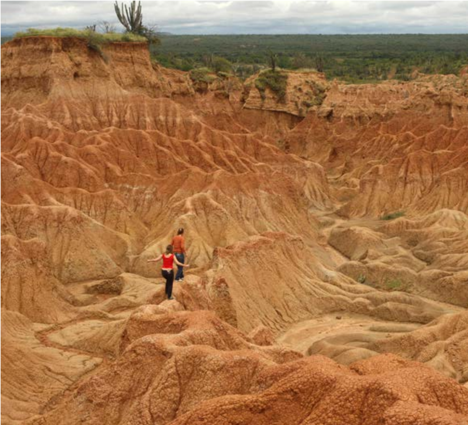
El Desierto de la Tatacoa