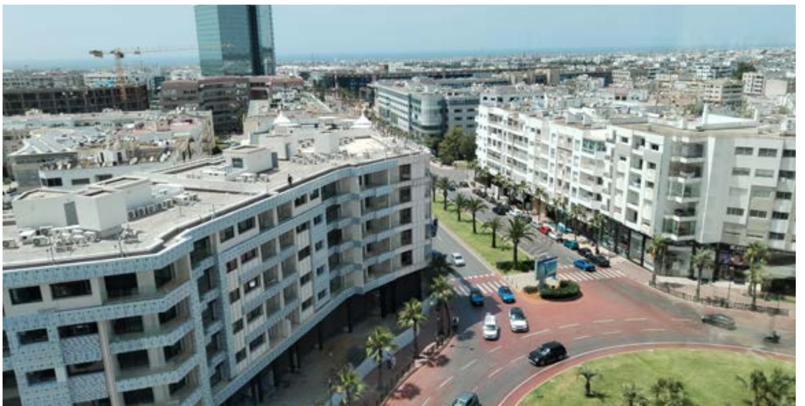
Rabat de la mano con la modernidad.

Llegar a Rabat desde España es un viaje muy sencillo. Los continentes europeo y africano están separados por tan solo 14 kilómetros de océano en el estrecho de Gibraltar, lo que