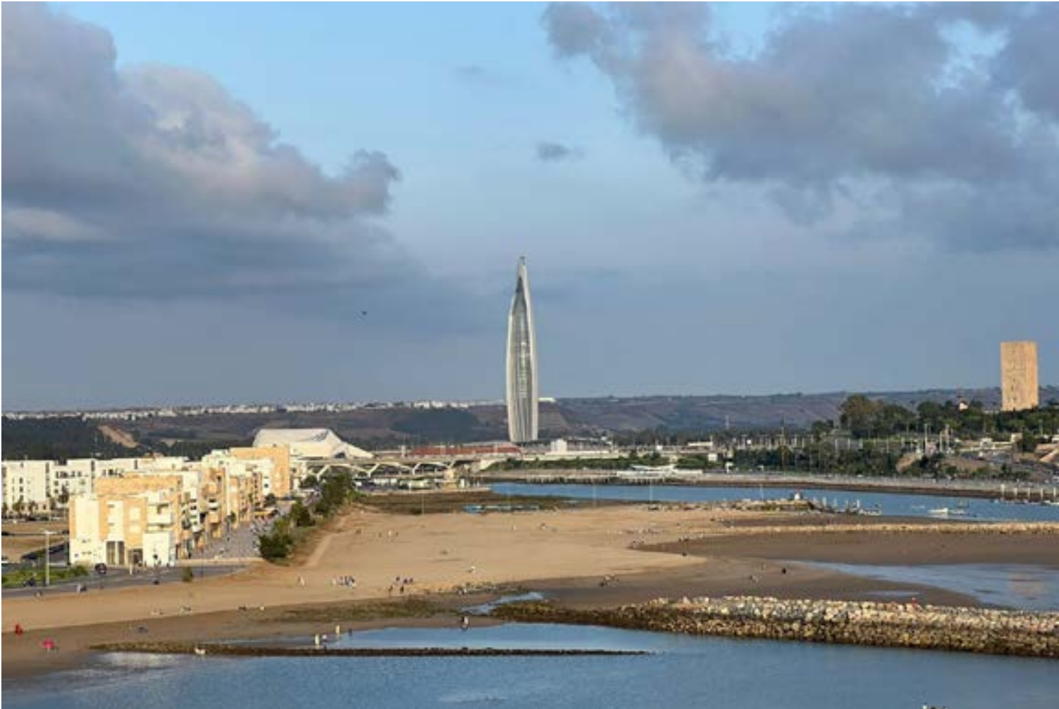
Con una altura total de 250m la torre Mohammed VI en Rabat, Marruecos, es actualmente la torre más alta de África.