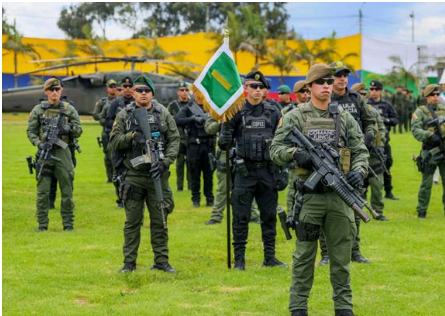
Fuerzas Especiales de la Policía Nacional