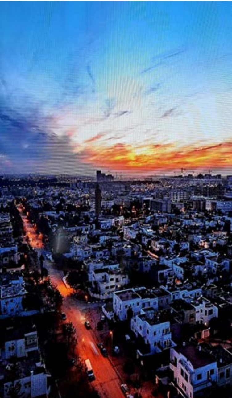
Amanecer en Rabat

permite ver la costa del país vecino desde el otro lado. Al cruzar, se siente el llamado de un continente que invita a la exploración.