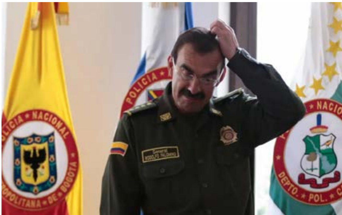
La Corte Suprema de Justicia declaró culpable al general en retiro Rodolfo Palomino por el delito de tráfico de influencias de servidor público.